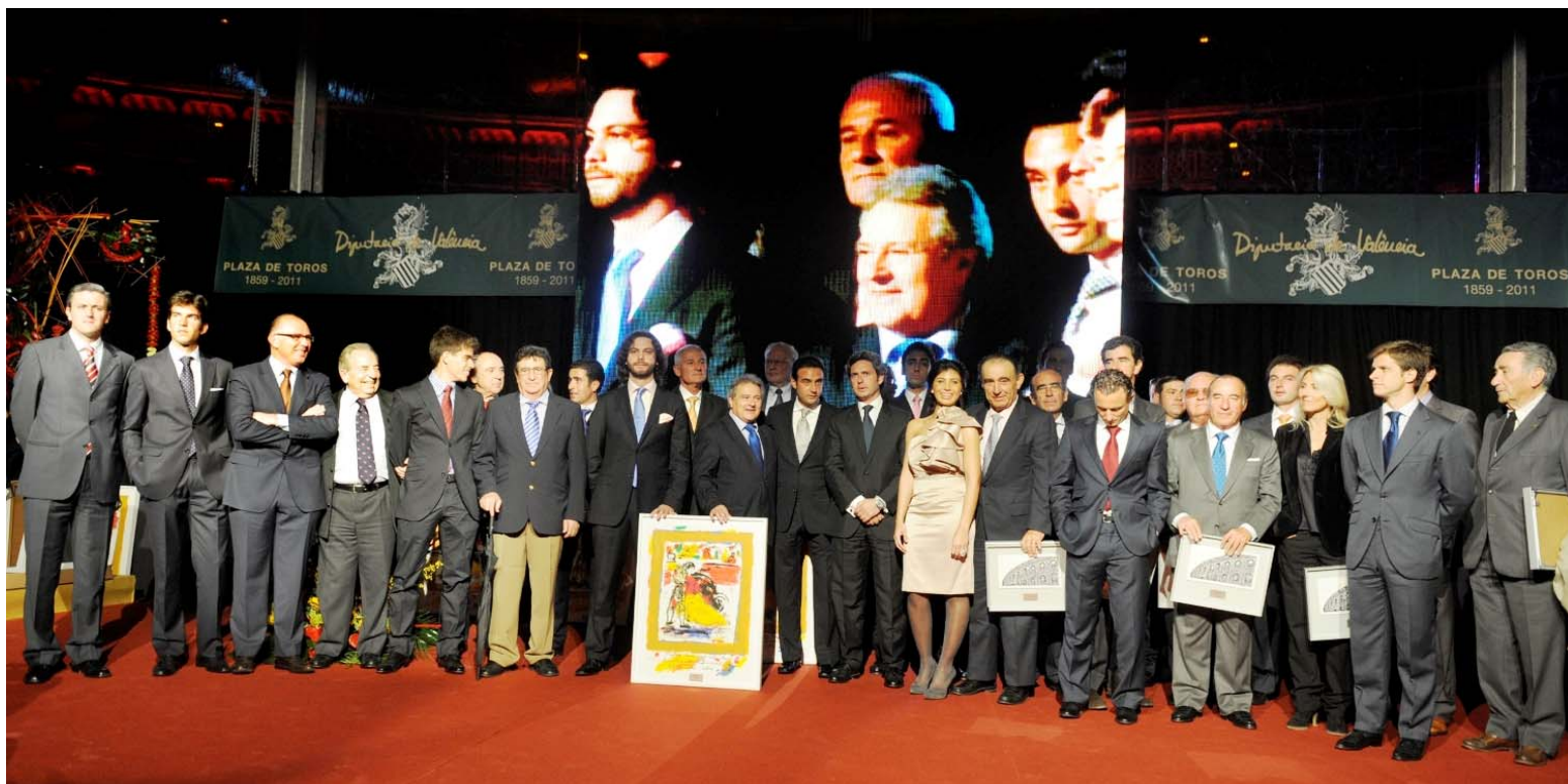
El acto concluyó con la entrega de los Trofeos Taurinos de la Diputación de Valencia correspondientes a las Ferias Taurinas de Julio y Fallas de 2009 y 2010.