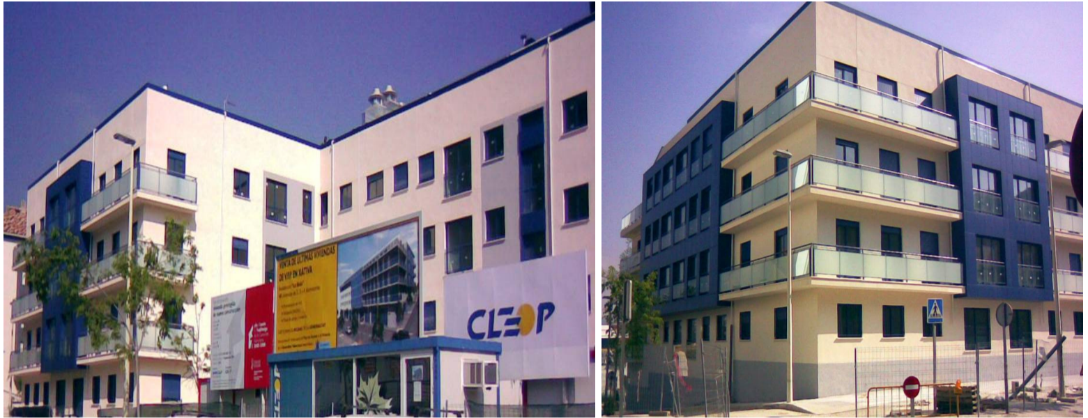
Varias imágenes de las fachadas del edificio construido por Cleop en un solar del sector R-1 'La Bola' de Xàtiva que presenta una superficie de 1.097,86m 2 . El edificio tiene una superficie total construida de 7.772m 2 .

El edificio, que comenzó a ejecutarse en septiembre de 2008, consta de tres plantas más una de ático, sótano y planta baja, y en él se disponen cuarenta y ocho viviendas de entre una y cuatro habitaciones, cuarenta y ocho trasteros, cincuenta y ocho plazas de aparcamiento y dos locales comerciales. Inmocleop es el promotor inmobiliario del proyecto 'La Bola' ejecutado por Cleop en el sector R-1 'de Xàtiva'.