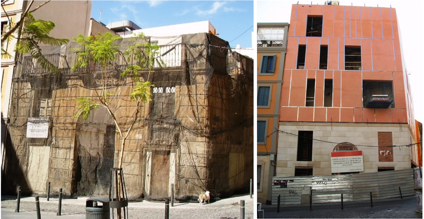
Ésta es la imagen del antes y el después que presenta el edificio alicantino, situado en la calle Orense.

Atrás ha quedado el antiguo aspecto que presentaba la sede del Consejo Regulador de la Denominación de Origen Alicante (CRDO Alicante) después de quince meses de trabajos desarrollados por Cleop y que se prolongarán hasta el próximo mes de julio, cuando el inmueble muestre su imagen definitiva.